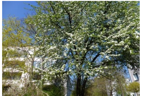
Plänterwald, äußerlich ein schöner Ortsteil

15€/m 2 Miete bezahlt, auch nicht solche luxuriöse Umgebung zusteht. Hinterhöfe waren doch