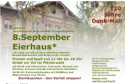
Das war 2012